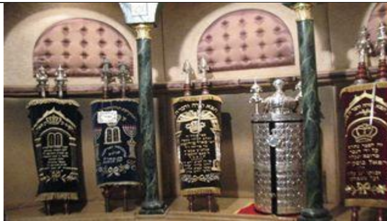
ביהכ"נ בית אל ב"דאר אל ביידה"